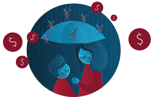
Prevenção da malária na estação chuvosa