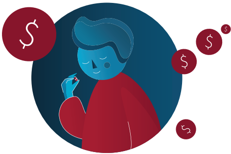
Medicamentos para TB adequados para crianças

Em 2016, a Unitaid introduziu o primeiro medicamento contra TB adequado para crianças, que agora está sendo usado em mais de 100 países. Em 2018, a Unitaid demonstrou que 18 milhões de casos de malária pediátrica poderiam ser evitados na região do Sahel da África com algumas doses do medicamento oral por criança. Países e parceiros aceitaram esse resultado e estão introduzindo amplamente o medicamento preventivo.